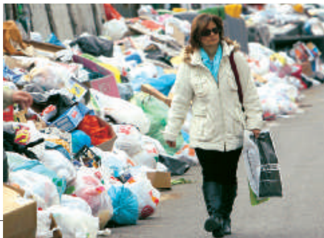
C. MORELLI / EMBLEMA

Da qualche parte funziona già. Per esempio nella zona di Polla, provincia di Salerno, e dintorni si raccolgono già oggi 20,5 chili di vetro da riciclare per abitante, 5 volte il valore medio degli altri comuni della Campania. ●