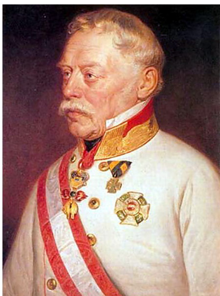
L'anziano Josef Radetzky

La piaggeria degli storiografi risorgimentalisti ha descritto l'episodio come uno «scontro fra titani»: da una parte un vecchio reazionario, intenzionato a punire quell'insignificante Piemonte cancellandolo dalla carta geografica, dall'altra un giovane re, risoluto nel rispetto e nella fedeltà ai principi della libertà e della costituzione. Essi misero in bocca a quest'ultimo la frase tanto cara alla retorica patriottarda: « I Savoia conoscono la via dell'esilio, mai quella del disonore ».