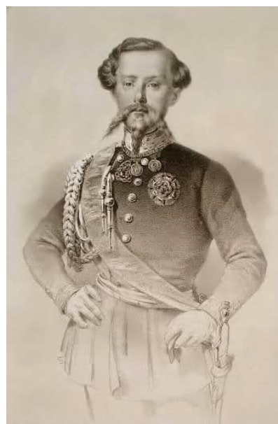
Il giovane Vittorio Emanuele II

Lorenzo Del Boca, nutrendo seri dubbi sulla veridicità di questa narrazione, ritiene che Vittorio Emanuele quella frase « probabilmente non la pronunciò mai, perché non era in grado di... pensarla ». (2)