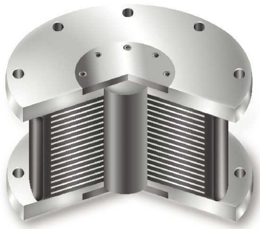
Isolatore sismico tipo LRB

I numerosi interessi e l'eccessivo frazionamento delle competenze che governano l'intero processo edilizio generano anch'essi difficoltà che si riflettono sul delicato settore della progettazione antisismica. Ed è proprio in quest'ambito che si sta manifestando un crescente