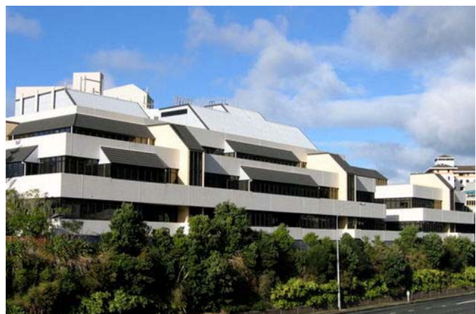
Il William Clyton Building di Wellington (NZ), primo edificio cui fu applicata la tecnica dell'isolamento alla base

coinvolgono competenze parallele, come quelle (è uno dei punti nodali) che riguardano i rapporti fra l'Ingegneria Sismica e l'Architettura; rapporti molto incerti, se non perfino inesistenti 3,4,5 . In questa situazione non mancano i problemi che derivano da atteggiamenti conservativi di una burocrazia che, muovendosi in un sistema amministrativo sempre più complicato, stenta a trasferire le novità in appropriati documenti legislativi. La recente sequenza dei provvedimenti normativi è un'occasionale esaltazione di questo aspetto, ma non ne costituisce la principale motivazione. Occorre infatti focalizzare l'attenzione su comportamenti involutivi più generali che in misura sempre maggiore ostacolano il trasferimento delle nuove