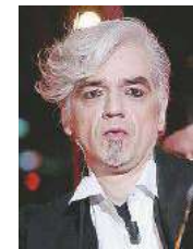
L'incompreso Morgan Ansa

Antonello Venditti ha pubblicato su Facebook