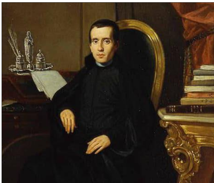
Jaime Balmes (1810-1848)