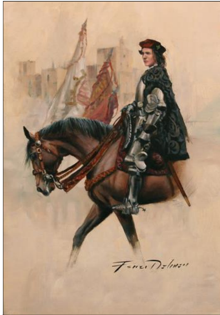
Il Gran Capitano visto da Augusto Ferrer Dalmau

Dopo la lunga Reconquista della Penisola Iberica come comandante dei Re Cattolici, si imbarcò per l'Italia nel 1495 per difendere la regione dagli invasori francesi. Il suo comando fu un successo, poiché sconfisse il nemico in Calabria ed entrò a Napoli da vincitore nel 1496. Fu allora che iniziò a essere definito il Gran Capitano . Le sue vittorie portarono alla firma di un trattato di pace tra le due parti, almeno per un certo periodo. Nel 1502, i venti di guerra soffiaron di nuovo e i Francesi ripresero le ostilità. Nell'ambito di questa nuova lotta, il 28